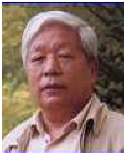
当代著名书画家于复千

于复千，别号于福谦，天津人。河西区政协委员、当代著名书画家，擅长中国画。1938年3月生于天津市，1959年毕业于中央美术学院附中，1964年毕业于中央美术学院国画系。历任天津群众艺术馆教师、创作员，天津市艺术学会会长，天津当代艺术进修学院院长、南开大学教授、日本创价大学教授、天津市艺术学会会长、中国书法艺术研究院院士，中国美术家协会会员。