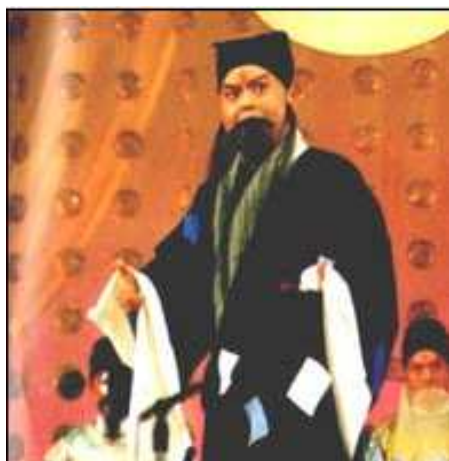
京剧表演艺术家杨乃彭

杨乃彭是一位京剧表演艺术家，国家一级演员，经过 40 余年的艺术实践，已在全国京剧界享有一定声誉，在当代老生中，是位佼佼者。这位河西区连任三届的政协委员，为各民主党派表演过多场京剧片断清唱，博得了众人的赞誉。他曾是中国戏剧梅花奖得主。由他领衔主演的演出团，北到哈尔滨、沈阳，南至上海、武汉，足迹遍布大江南北，唱红了大半个中国，获得了各地观众的交口称赞。