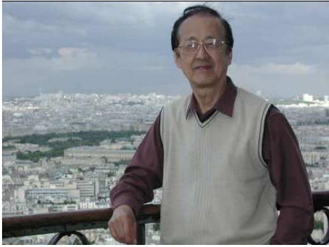
话剧表演艺术家左杰

具有学者风范的左杰是一位表演艺术家，国家一级演员。他在 40 余年的演艺生涯中，既演话剧，又演影视剧，在表演艺术上，充分展示了自己的才华。