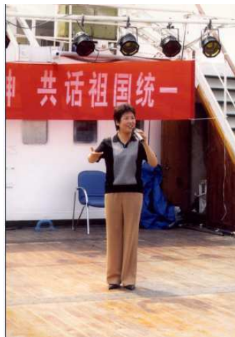
陈春在河西政协举办的联欢会上演唱

陈春，1963年出生于河北省白洋淀边安新县，中共党员，河西区政协第十一、十二届文化委员会委员。国家一级演员、中国戏剧家协会会员、天津戏剧家协会副主席，天津市政协委员，天津市青联常委，天津市第十届妇代会代表，天津市首届“德艺双馨”文艺工作者，中国戏剧梅花奖得主，国务院特殊津贴享受者。