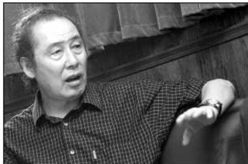
话剧表演艺术家李起厚

在河西区政协第十一届委员会大会闭幕后，笔者采访了连任五届区政协常委、天津电影家协会副主席、国家一级演员、享受政府特殊津贴的话剧表演艺术家李起厚。他高高的个子，浓眉大眼，说起话来很风趣，从他那手舞足蹈的说话样子，很难让人相信，他已是古稀之年的老人了。