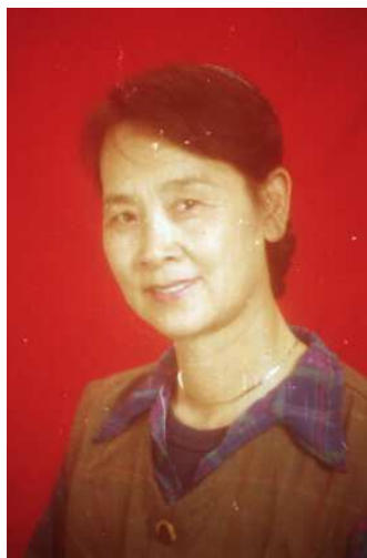
著名民歌歌唱家李绮